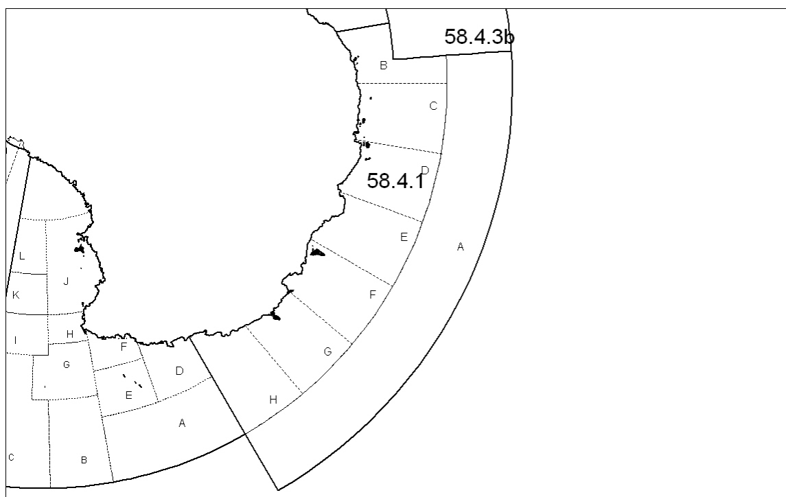
Figure 1 : Carte générale de la division 58.4.1 et emplacement des SSRU (A–H dans cette sous-zone).

2. En 2007/08, la pêche exploratoire de Dissostichus spp. de la division 58.4.1 était limitée aux navires battant pavillon australien, coréen, espagnol, japonais, namibien, néo-zélandais, ukrainien et uruguayen utilisant uniquement des palangres (mesure de conservation 41-11). Une limite de précaution de 600 tonnes, avec un maximum de 200 tonnes pour chacune des SSRU C, E et G (voir la figure 1), avait été fixée pour la capture de Dissostichus spp. Cinq autres SSRU (A, B, D, F et H) étaient fermées à la pêche, mais la pêche de recherche y était autorisée, avec une limite de 10 tonnes de Dissostichus spp. et un navire par SSRU. La pêche à des profondeurs de moins de 550 m était interdite afin de protéger les communautés benthiques. Les limites de capture accessoire étaient définies par la mesure de conservation 33-03. La saison de pêche était comprise entre le 1 er décembre 2007 et le 30 novembre 2008.